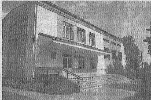
У гэтым будынку некалі віравала культурнае жыццё рэспубліканскага маштабу