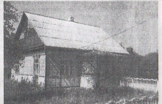
Дом, у якім жыў славуты старшыня на вуліцы, што цяпер носіць яго імя